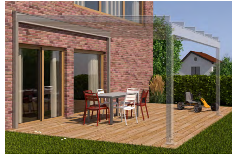
Beispiel Klinkerfassade, Tragender Wandanschluss und Terrazza Sempra