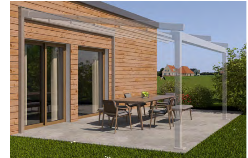
Beispiel Fertighaus an Holzständerwerk, Tragender Wandanschluss und weinor PergoTex II