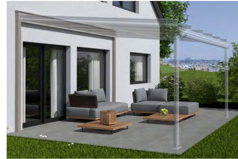
Beispiel stark gedämmte Hausfassade, Tragender Wandanschluss und Terrazza Originale