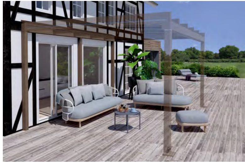
Beispiel Fachwerkfassade, Tragender Wandanschluss und Terrazza Pure